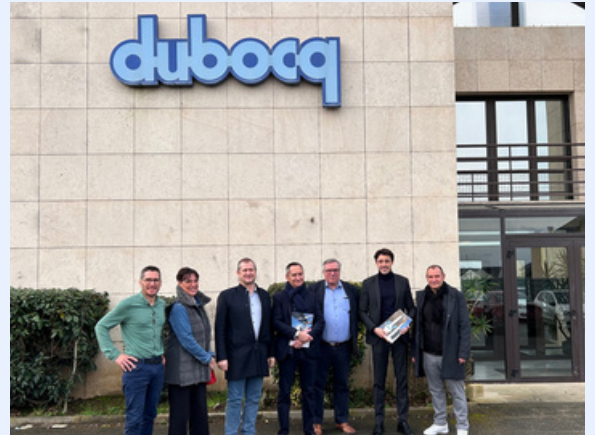
Visite de l'entreprise de construction Dubocq à Saint-Vrain