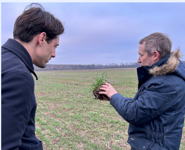
Visite de l'Huilerie de l'Orme Creux à Corbreuse