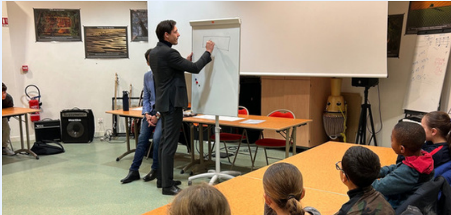
Intervention au parlement des enfants d' Étréchy