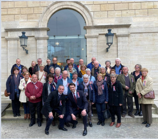
▲ Visite à l'Assemblée du club des Séniors de Dourdan