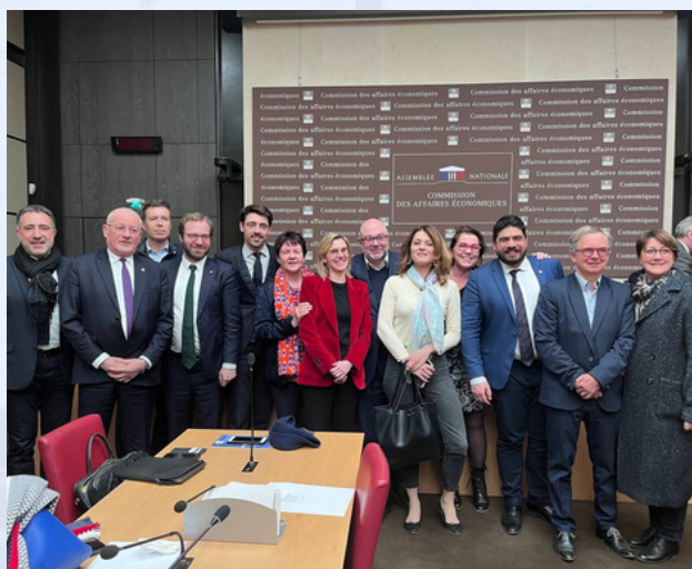
Les députés Renaissance de la Commission des Affaires économiques autour d'Agnès Pannier Runacher à l'issue des travaux sur le PJJ nucléaire

Ce mois de mars a été marqué par une grande richesse de textes législatifs ! En première ligne, la question énergétique avec le projet de loi sur le nucléaire qui accélère la construction des futurs EPR2 en allégeant les procédures et supprime la limite de puissance installée . Ce texte est un grand pas en avant pour la souveraineté énergétique de notre pays et pour nos objectifs de décarbonation ! Il a d'ailleurs rassemblé une large majorité à l'Assemblée (402 voix pour !).