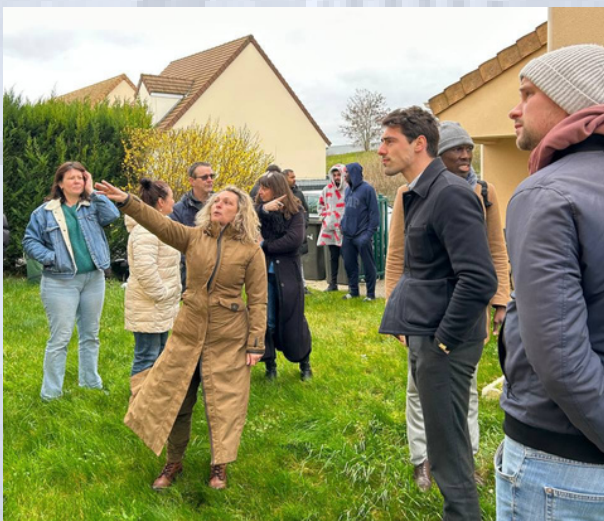
▲ Rencontre avec le collectif des Ardoisiers à Brétigny-sur-Orge