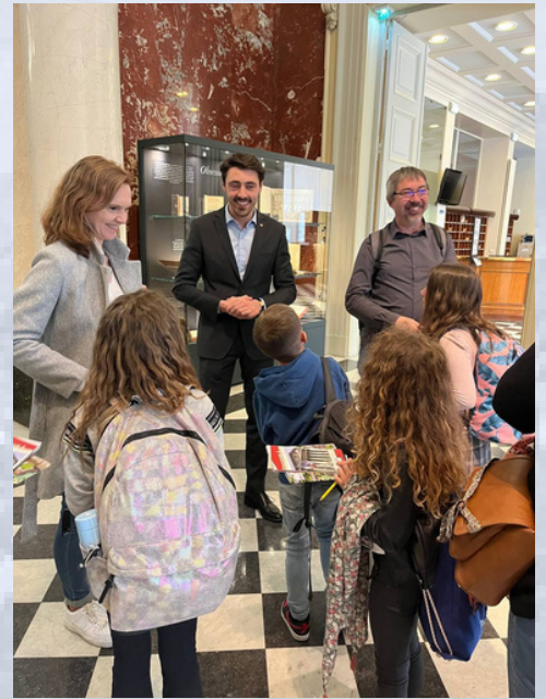
▲ Visite à l'Assemblée du Conseil Municipal des Enfants de Bouray-sur-Juine